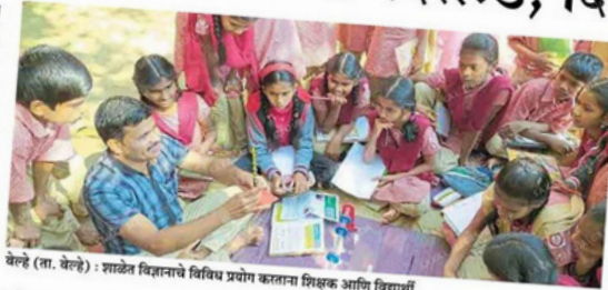
वेल्ले (ता. वेल्ले) : शाळेत विज्ञानाचे विविध प्रयोग कालानुसार शिक्षक आणि विद्यार्थी.

या क्लबच्या माध्यमातून व शाळेतील नावोन्मुख विज्ञान केंद्राच्या साहाय्याने शाळेत विज्ञान व परिचय अभ्यासाचे नावोन्मुख उपक्रम राबविले जातात. तसेच या शाळेत विविध ॲपचा उपयोग करून सुविधासदा साधविणे, मुलाल मर्यादा साहाय्याने प्रशांचा अभ्यास, चंद्र मिरीलिंग कार्यक्रम, राशीची रचना यांचा समावेश