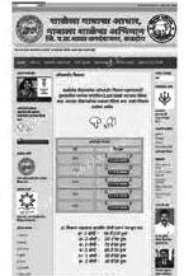
नावलीक उपक्रमशाली शाळा म्हणून होत आहे.

या वेबसाईटवर लिंक उपलब्ध केल्याचे श्री. खोसे यांनी सांगितले. जिल्ह्यात शाळेचा म्हणून होत आहे.