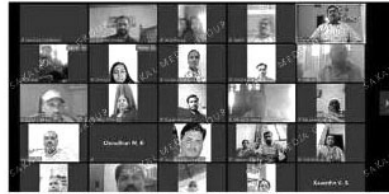
उमरगा : ऑनलाईन बैठकीत सहभागी अधिकारी (दुसऱ्या छायाचित्र) ऑनलाईन गुणपत्रिका.