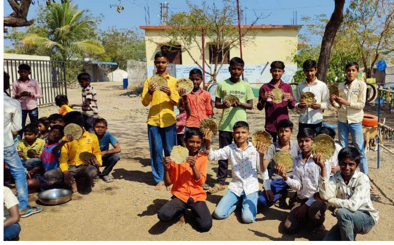
स्पर्धेत विद्यार्थ्यांनी बनविलेल्या भाकरी