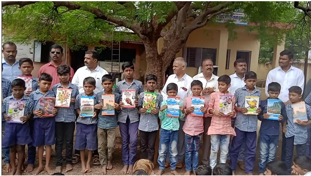
भाकरी स्पर्धा बक्षिस वितरण