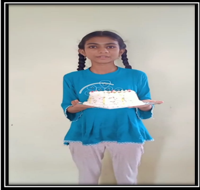
हिबारे सिध्दी प्रवर्ग- HA या विद्यार्थीनीने विशेष शिक्षक यांच्या वाढदिवसानिमीत्त केक बनवला.

दिवाळी निमित्त 60 दिव्यांग विद्यार्थ्यांनी आकाश कंदिल बनवून आपल्या घरी लावले.