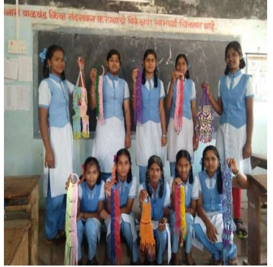
लोकर व मायक्रॉन वस्तू निर्मिती करताना विद्यार्थी