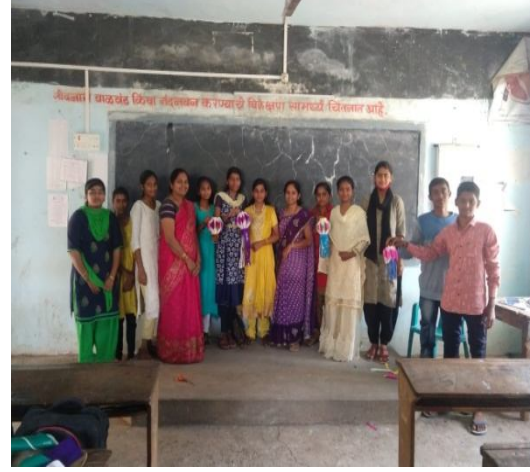
आकाशकंदील बनवताना विद्यार्थी