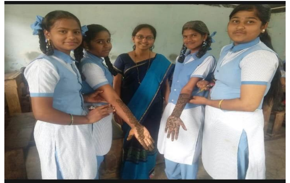
मेहंदी काढताना विद्यार्थिनी