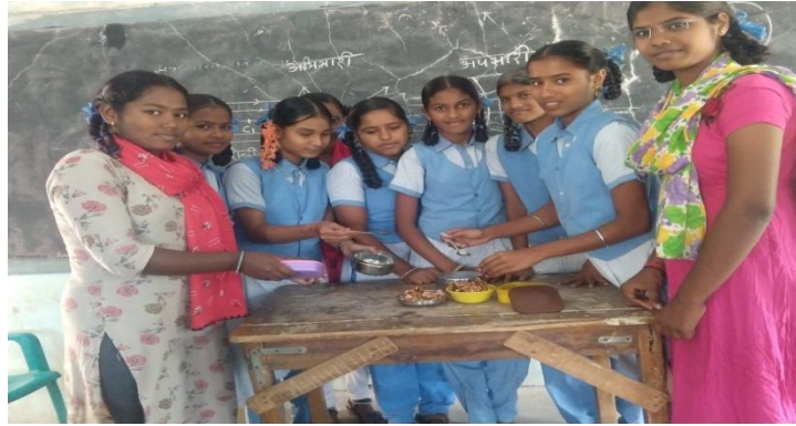
शेंगदाण्याची चिक्की, तिळाची चिक्की बनवताना विद्यार्थिनी

मल्टीस्किल फाऊंडेशन कोर्स अंतर्गत विद्यार्थिनी चिक्कीबनवायला शिकले होतेच. त्यांना त्या कलेचा संबंध व्यवसायाशी जोडून दिला. छोट्या छोट्या पिशव्या (वजनानुसार) - चिक्कीची पाकिटे बनवली. बाजारभावापेक्षा कमी किंमतीत विक्री केली. विद्यार्थ्यांचा आर्थिक फायदा झाला.