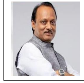
मा.ना.अजित पवार उपमुख्यमंत्री महाराष्ट्र राज्य