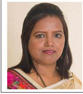
प्रा.वर्षा गायकवाड मंत्री शालेय शिक्षण विभाग महाराष्ट्र राज्य