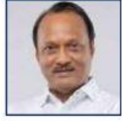
محترم اجیت جی پوار نائب وزیر اعلیٰ ریاست مہاراشٹر