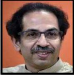
محترم اڈھوجی ٹھاکرے وزیر اعلیٰ ریاست مہاراشٹر