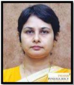
محترمہ وندنا کرشنا (IAS) چیف ایڈیشنل سیکریٹری شعبہ اسکولی تعلیمی و کھیل ریاست مہاراشٹر