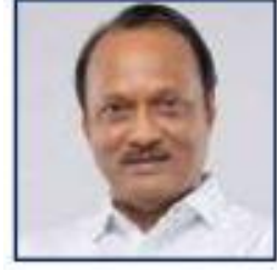
محترم اجیت جی پوار نائب وزیر اعلیٰ ریاست مہاراشٹر