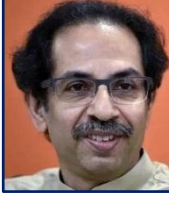
मा.ना.उद्धवजी ठाकरे मुख्यमंत्री महाराष्ट्र राज्य